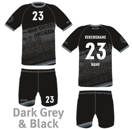
Dark Grey & Black