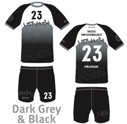
Dark Grey & Black