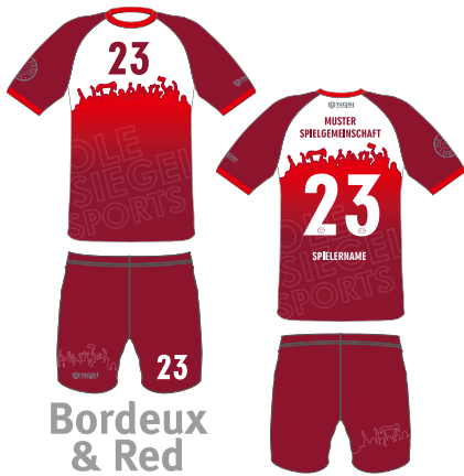
Bordeux & Red