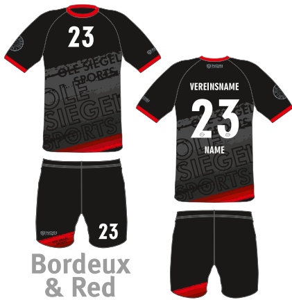
Bordeux & Red