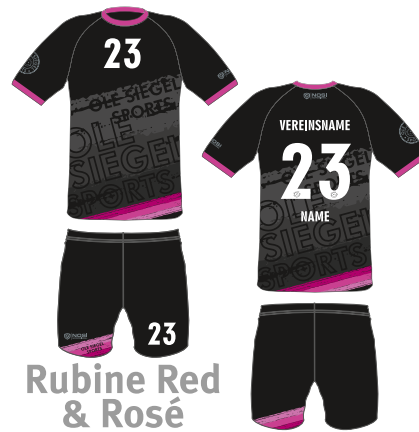
Rubine Red & Rosé