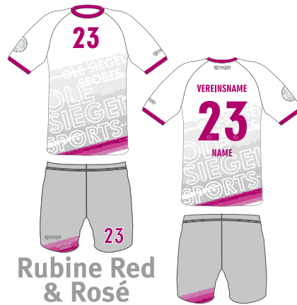
Rubine Red & Rosé