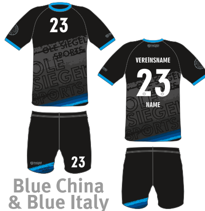
Blue China & Blue Italy