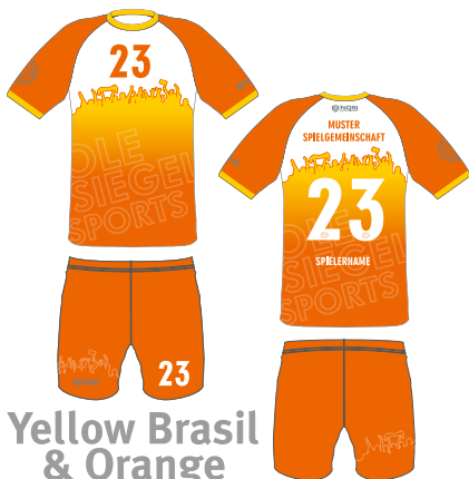
Yellow Brasil & Orange