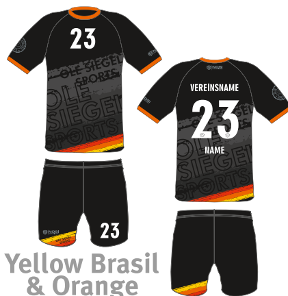
Yellow Brasil & Orange