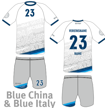
Blue China & Blue Italy