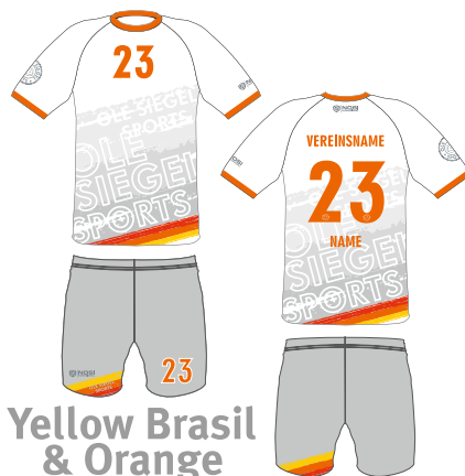
Yellow Brasil & Orange