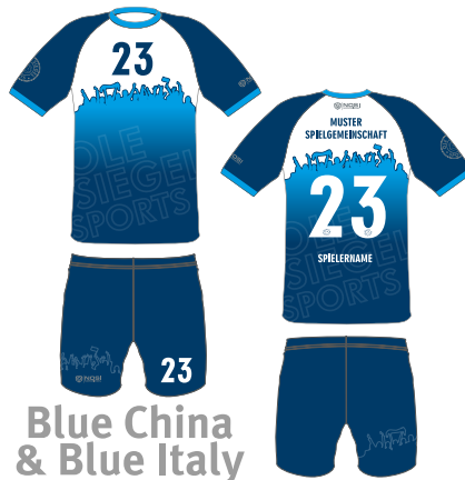
Blue China & Blue Italy