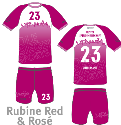
Rubine Red & Rosé