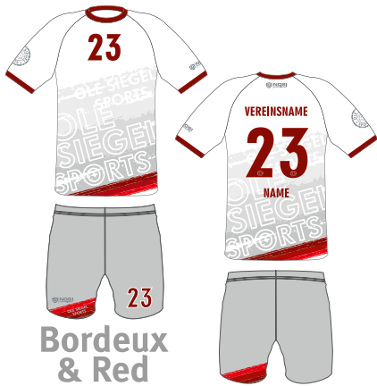
Bordeaux & Red