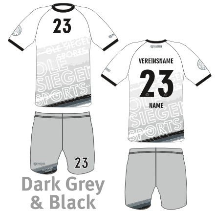
Dark Grey & Black